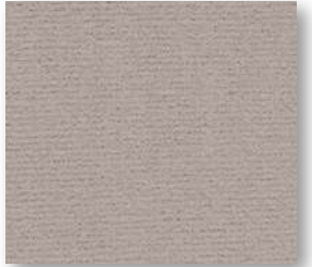
▲ 34 4 m