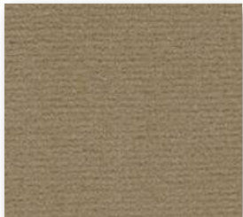
▲ 49 4&5 m