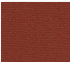
▲ 165 4 m