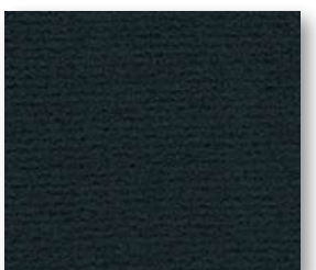
▲ 198 4 m