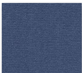
▲ 179 4 m