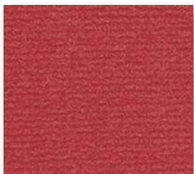
▲ 12 4 m