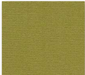
▲ 223 4 m