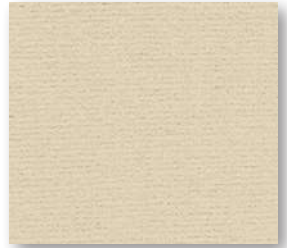
▲ 30 4&5 m