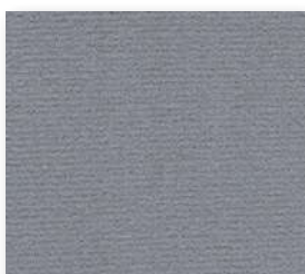
▲ 97 4&5 m