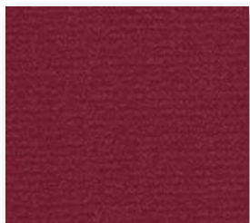
▲ 16 4&5 m