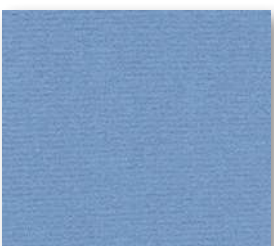
▲ 78 4 m