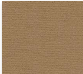
▲ 43 4 m