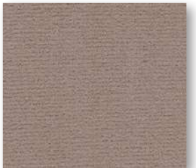
▲ 45 4 m