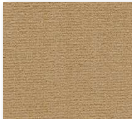
▲ 40 4&5 m