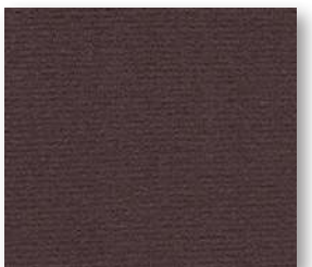
▲ 94 4 m