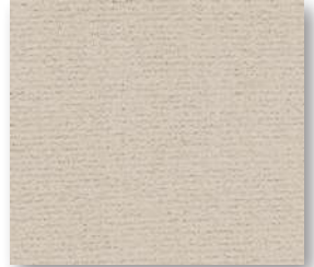
▲ 38 4 m