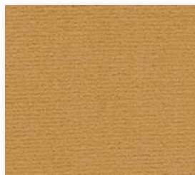
▲ 152 4 m