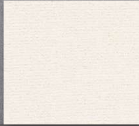
▲ 33 4 m