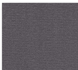
▲ 98 4&5 m